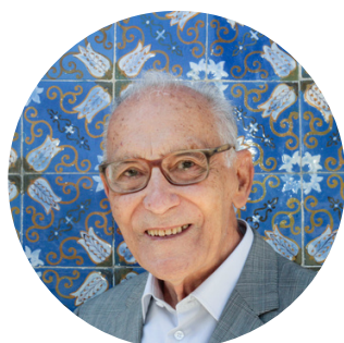
para o Calendário APG 365, edição de 2024.